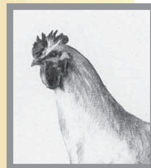
نمونه طراحی با مداد معمولی