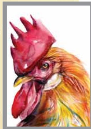
نمونه اکولین / جوهر رنگی